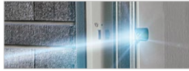
Lichtschanke für Garagentore