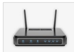
Handelsüblicher Router Erhältlich: Unter anderem im Elektronik-Fachhandel oder bereits vorhanden